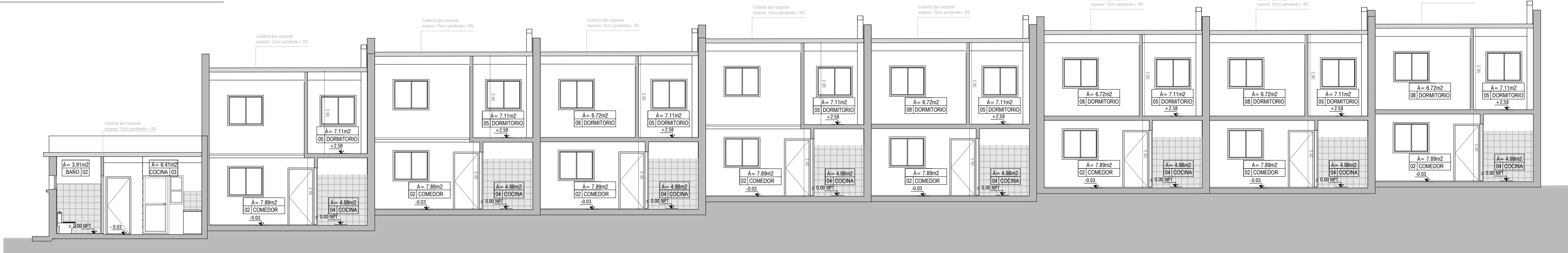
CORTE LONGITUDINAL BLOQUE B escala 1/100