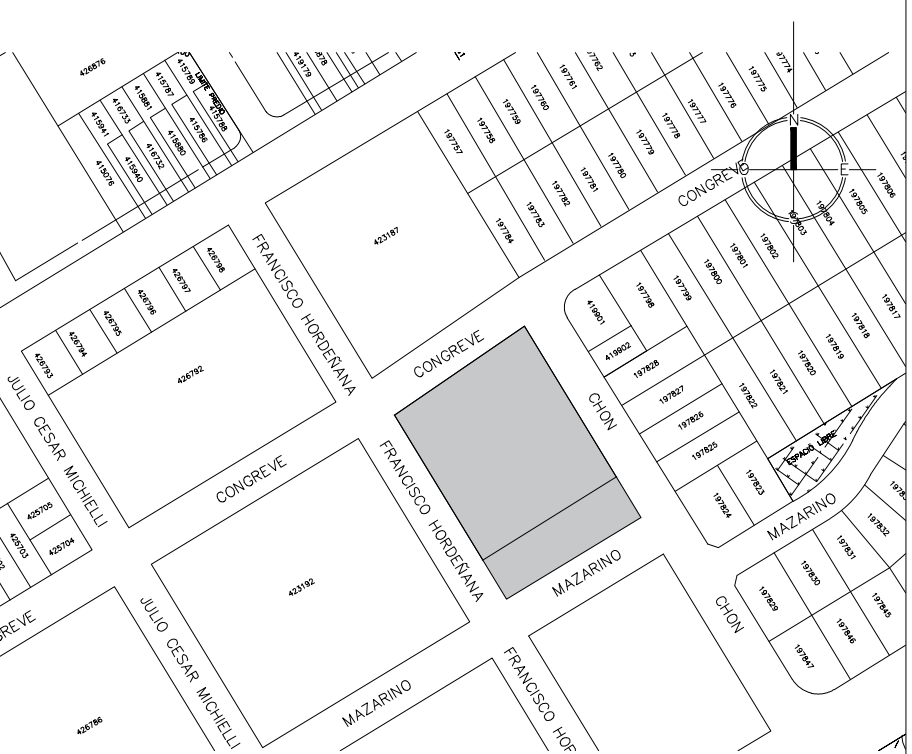
PLANO DE UBICACIÓN escala 1/1000